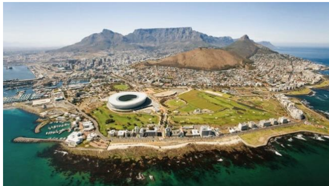
Table Mountain không chỉ là biểu tượng của Cape Town mà còn là một trong những cấu trúc địa chất cổ xưa nhất thế giới. Phần lớn ngọn núi được tạo thành từ sa thạch Table Mountain Sandstone , có niên đại lên đến khoảng 260 triệu năm , nằm trên nền đá granit còn cổ hơn nữa. Chính lớp sa thạch bền chắc này giúp ngọn núi giữ được đỉnh phẳng độc đáo, ít bị bào mòn dù trải qua hàng triệu năm tác động của gió và nước.

Đi cáp treo lên Table Mountain (tùy thời tiết) – biểu tượng của Nam Phi với đỉnh núi phẳng tuyệt đẹp. Từ đây có thể ngắm toàn cảnh Cape Town và đại dương xanh thẳm.